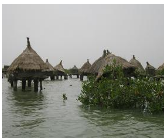
Greniers à mil sur pilotis (Joal-Fadiouth)