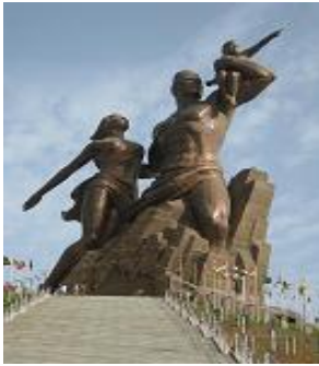
statue de la renaissance africaine