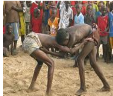
lutte traditionnelle sérère