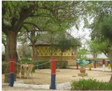
campement « les mindiss à Fatick »