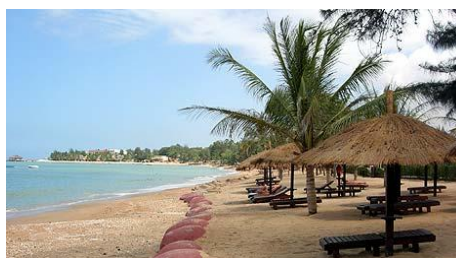
Plage de Saly