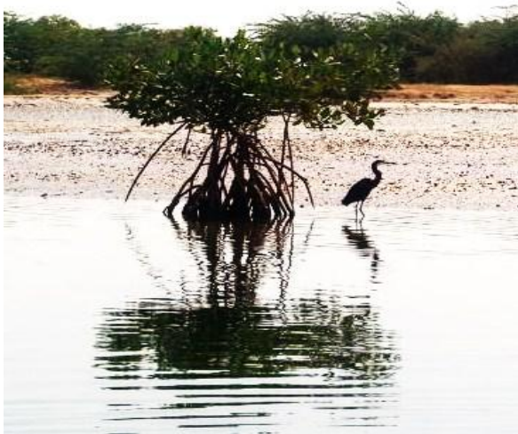
Un héron au pied d'un palétuvier dans les bolongs de Foundiougne