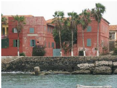
Ile de Gorée

Gorée, statue de la renaissance: 45 € pour deux personnes, 34 € pour trois personnes.